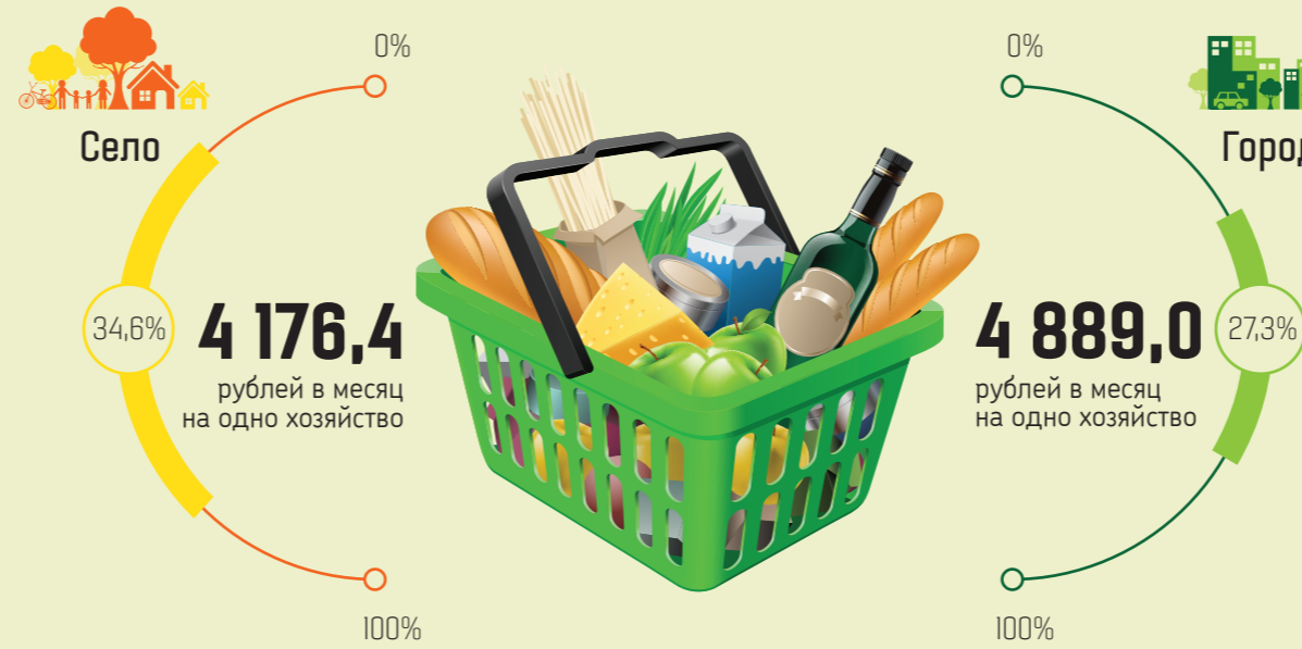
Стоимость основных продуктов питания, потребленных в домашних хозяйствах в 2014 г.