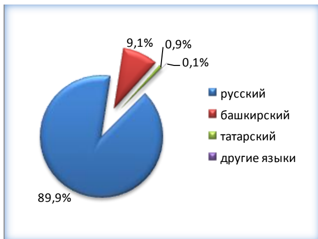
по языку обучения