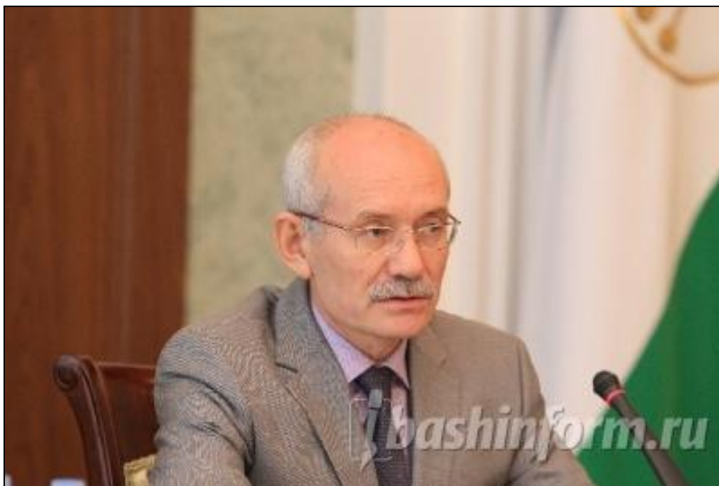
ФОТО-МОМЕНТЫ РАСШИРЕННОГО ВИДЕОСЕЛЕКТОРНОГО СОВЕЩАНИЯ ПО ВОПРОСУ ПОДГОТОВКИ И ПРОВЕДЕНИЯ В РЕСПУБЛИКЕ БАШКОРТОСТАН ВСЕРОССИЙСКОЙ ПЕРЕПИСИ НАСЕЛЕНИЯ 2010 ГОДА